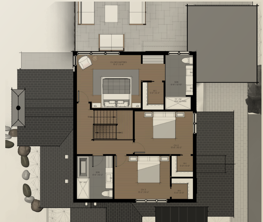
PLAN DE L'ÉTAGE