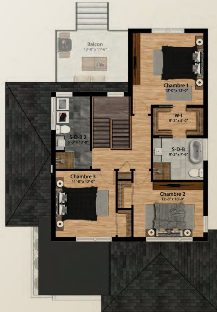
PLAN DE L'ÉTAGE 905 PI.CA.

SUPERFICIE DE 1 804 PI.CA. | GARAGE 348 PI.CA. | 3 CHAMBRES | 2 ½ SALLES DE BAIN