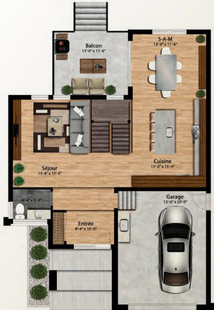
PLAN DU REZ-DE-CHAUSSÉE 899 PI.CA.