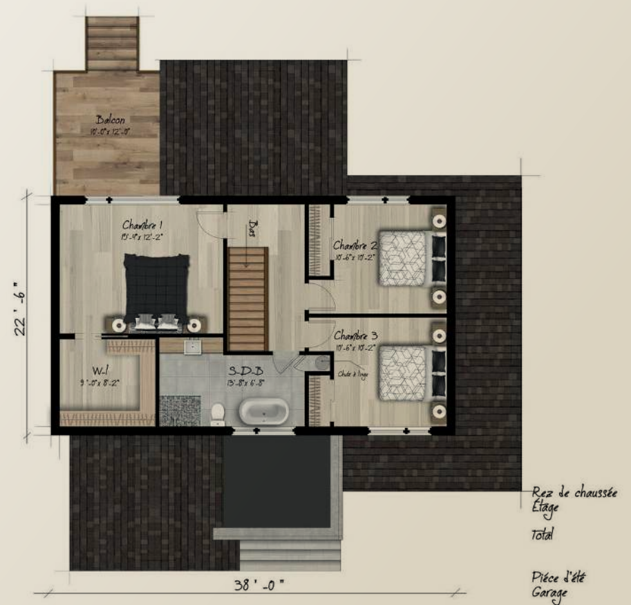
PLAN DE L'ÉTAGE 825 PI.CA.

SUPERFICIE DE 1 644 PI.CA. | GARAGE 435 PI.CA. | 3 CHAMBRES | 1 ½ SALLE DE BAIN | 1 SALLE DE LAVAGE